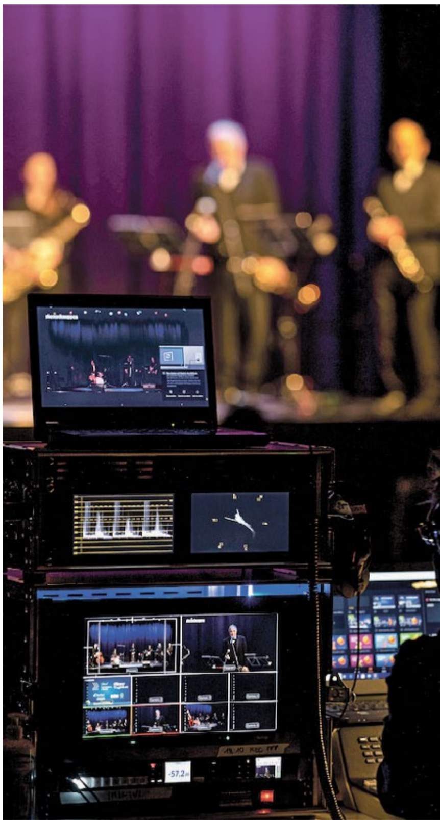
Solothurner Kulturschaffende erhalten in der Oltner Schützi eine professionelle Infrastruktur und die Unterstützung von erfahrenen Technikern.